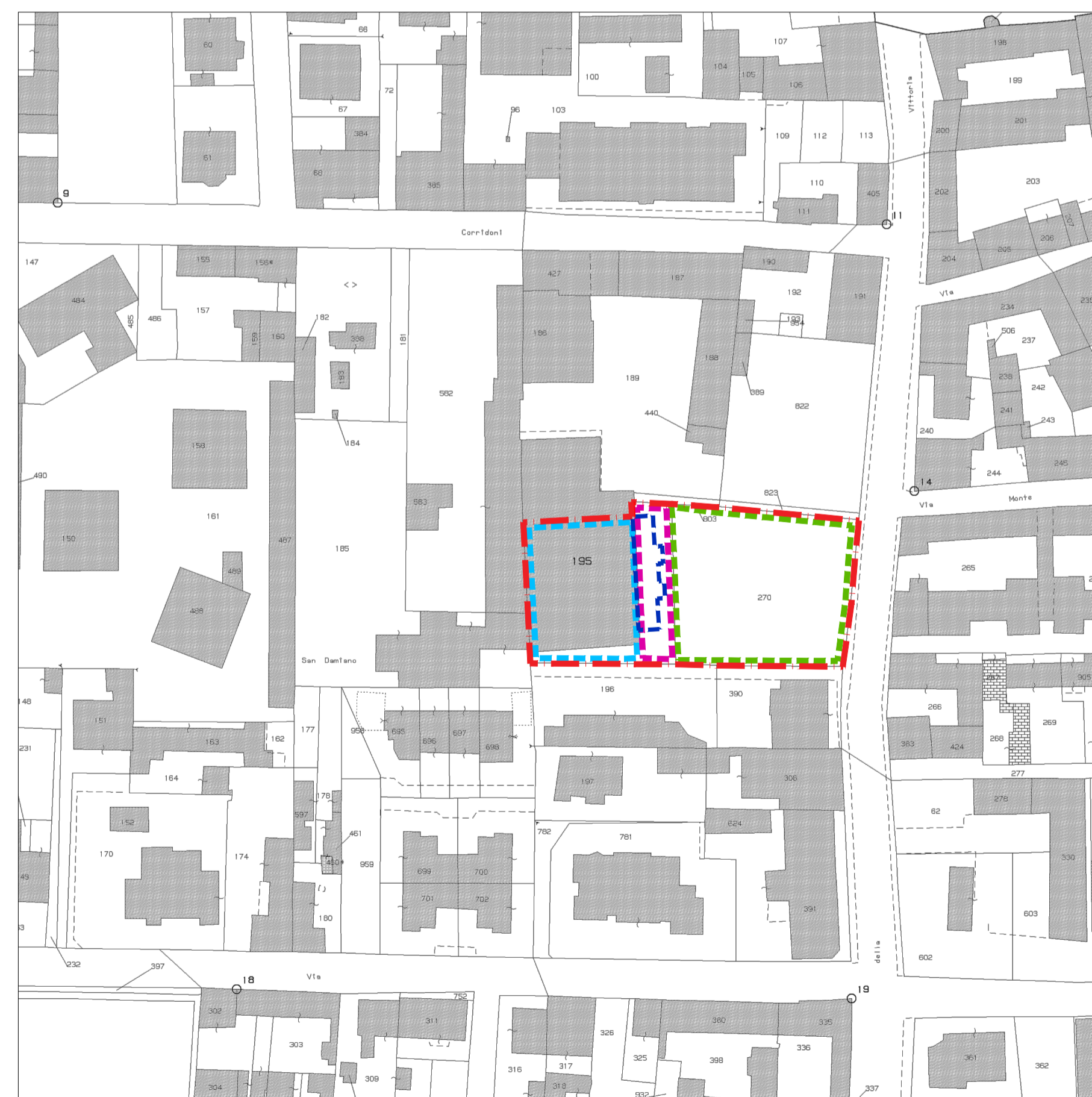
ESTRATTO MAPPA CATASTALE_ Foglio 2 - Mappali 195 (sub. 502), 270