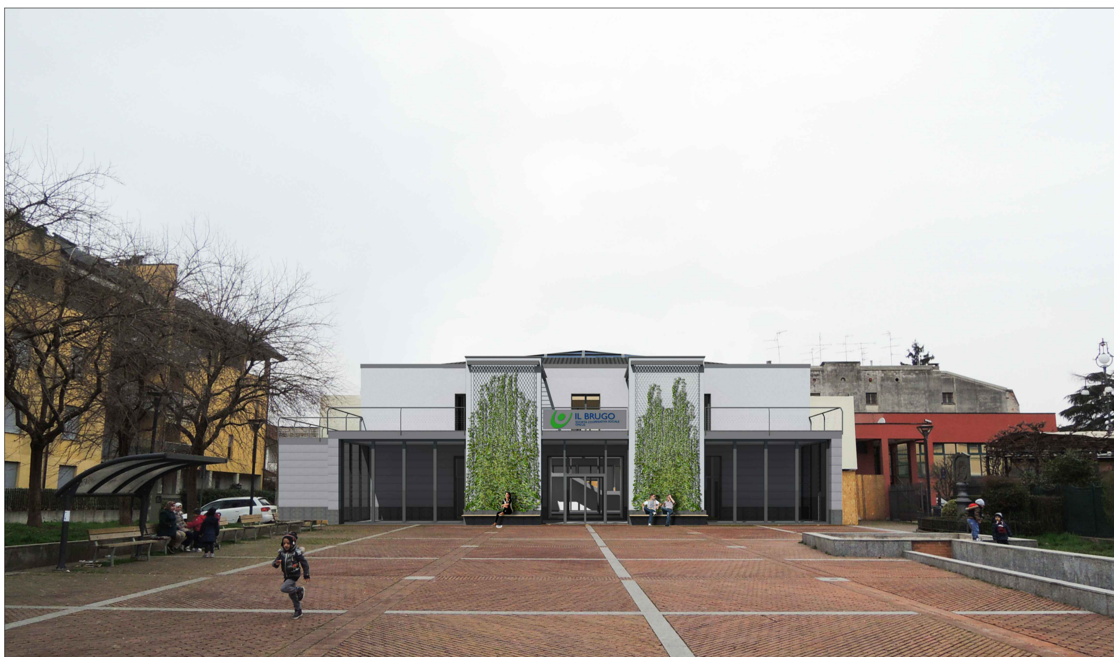
IMMAGINE C_FOTOINSERIMENTO PROSPETTO EST SU PIAZZA VIRGO FIDELIS