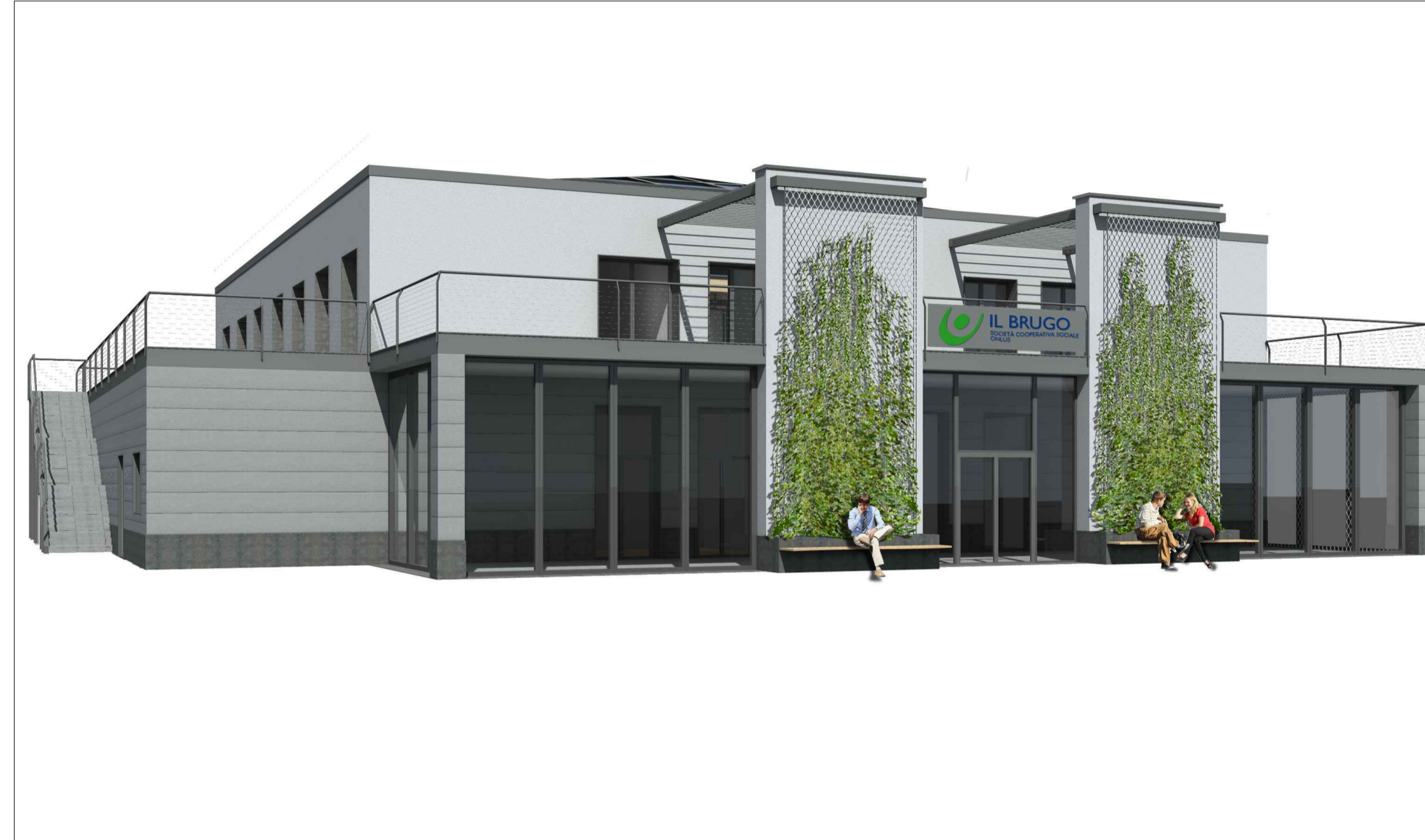
IMMAGINE B_VISTA DA PIAZZA VIRGO FIDELIS - ALTEZZA UOMO