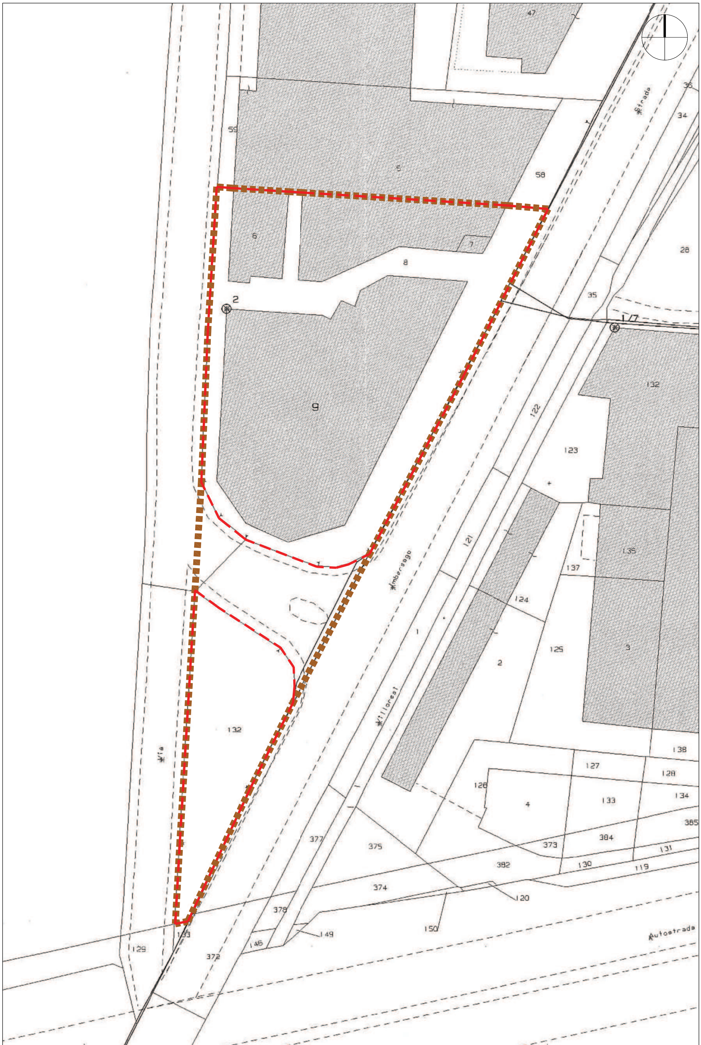
Estratto di mappa catastale, scala 1:500 Riperimetrazione ambito ARU-05 su estratto di mappa catastale in base all'Art. 6 comma 7 NTA di PGT del Comune di Brugherio documento PR-01