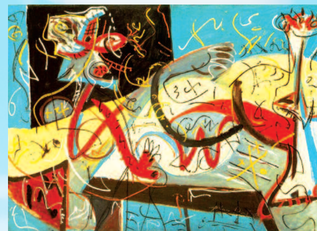
Jackson Pollock, Stenographic Figure (1942)