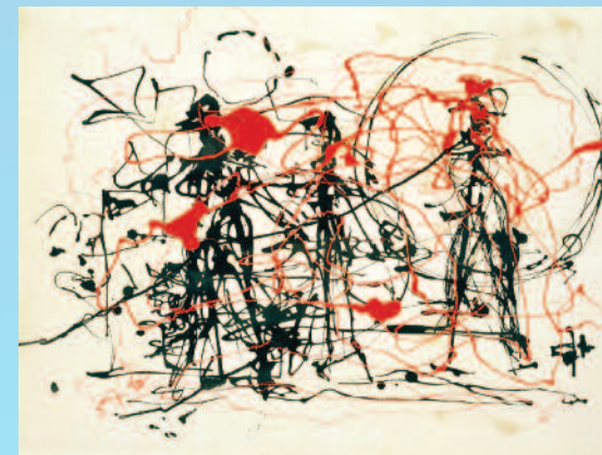
Jackson Pollock, Untitled (1948/9)

è un'iniziativa dell'Amministrazione comunale di Brugherio, ideata e organizzata dalla Biblioteca civica, in collaborazione con Elena Cattaneo, scienziata e senatrice a vita.